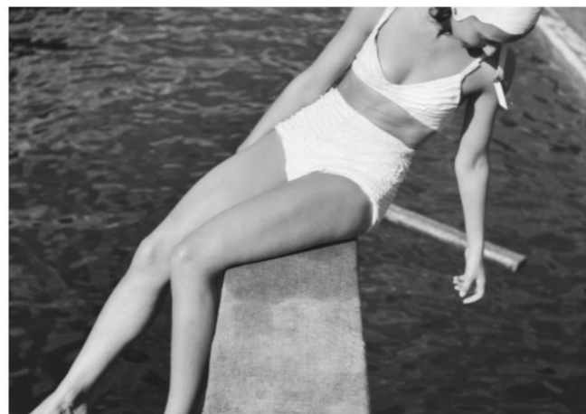
Молодая женщина на озере, Германия 1930 год.

Архивные кадры имеют высокую ценность, потому что при их просмотре можно прикоснуться